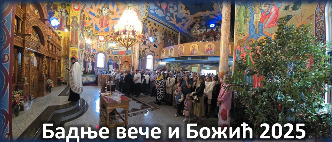
Бадње вече и Божић 2025